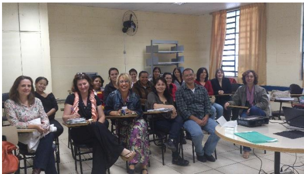
Curso Humanarte-Campinas 2013

“Expressão Oral e Escrita Através da Arte”