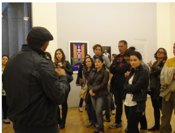
Curso Humanarte – Campinas 2014: visita à Pinacoteca