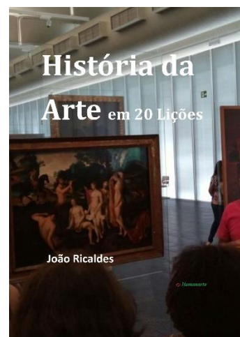
“História da Arte em 20 Lições”