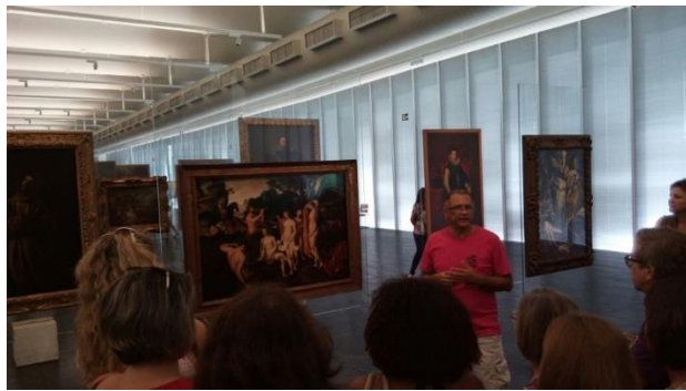
Curso Humanarte – Olímpia 2016: visita ao Masp